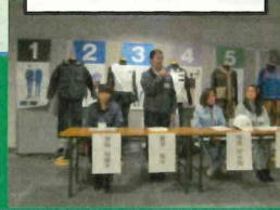
トークショー(イメージ)