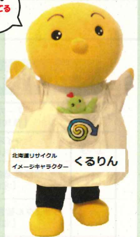
北海道リサイクル イメージキャラクター くるりん