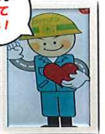
札幌市建設局キャラクター 「まごころ コウジくん」