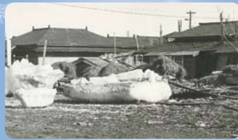
十勝沖地震津波(1952)で打ち上げられた流水