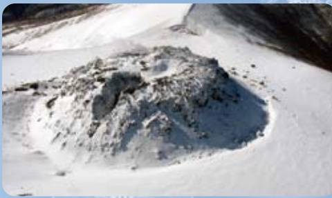
冬の樽前山火山口